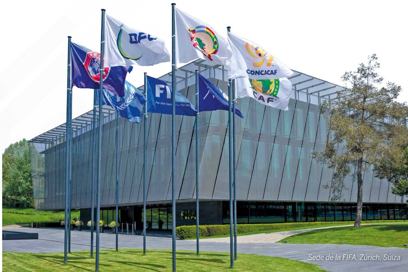
Sede de la FIFA, Zúrich, Suiza