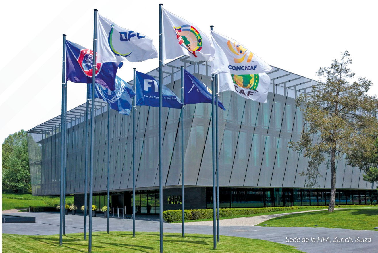
Sede de la FIFA, Zúrich, Suiza